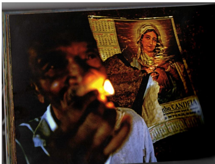
Figura 1. Quilombola na Serra do Talhado. Nordeste desvelado (2012). É também a capa do CD Nordeste oculto .

A canção Jurema é a primeira do CD Nordeste oculto . Possui um trecho do poema do poeta inglês William Blake traduzido por Alberto Marsicano e declamado pelo ator paraibano Luis Carlos Vasconcelos. Na canção encontram-se elementos religiosos nordestinos, como a jurema e os índios tupinambás. A palavra jurema foi utilizada com significado duplo: vegetal (planta mimosa ou jurema preta) e local sagrado, segundo o vocalista da Cabruêra , Arthur Pessoa, em entrevista (09.04.2014 - João Pessoa - PB). A figura 1 está relacionada à canção e apresenta um senhor sertanejo com uma chama na mão e um calendário gasto pelo tempo e rasgado com a foto de Nossa Senhora ao fundo.