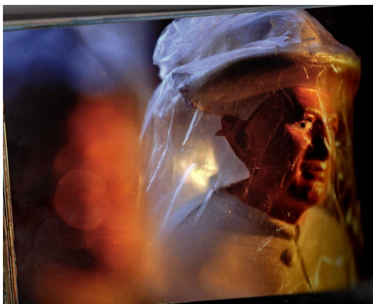
Figura 3. Feira de artesanato da Igreja do Socorro. Nordeste desvelado (2012).

A sexta faixa do CD, Padre Cícero , aborda o local de devoção da personalidade religiosa: Juazeiro (CE). A figura 3 está relacionada a essa canção e apresenta uma imagem de Padre Cícero embalada em um plástico.